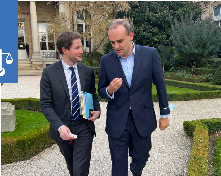
Clément Beaune, Secrétaire d'État chargé des affaires européennes